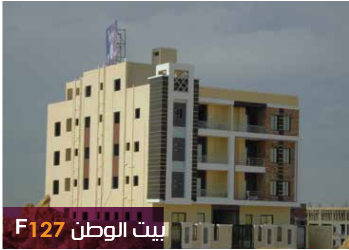
بيت الوطن F127