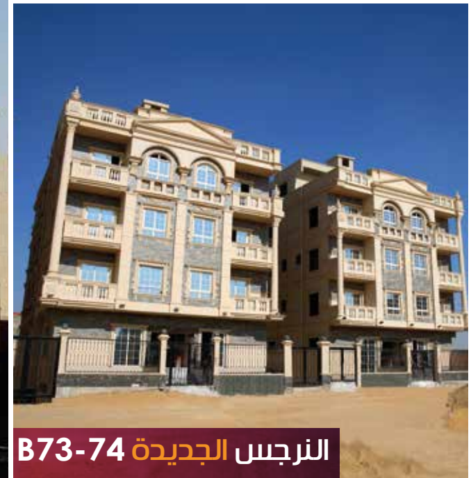
الترجس الجديدة 74-73