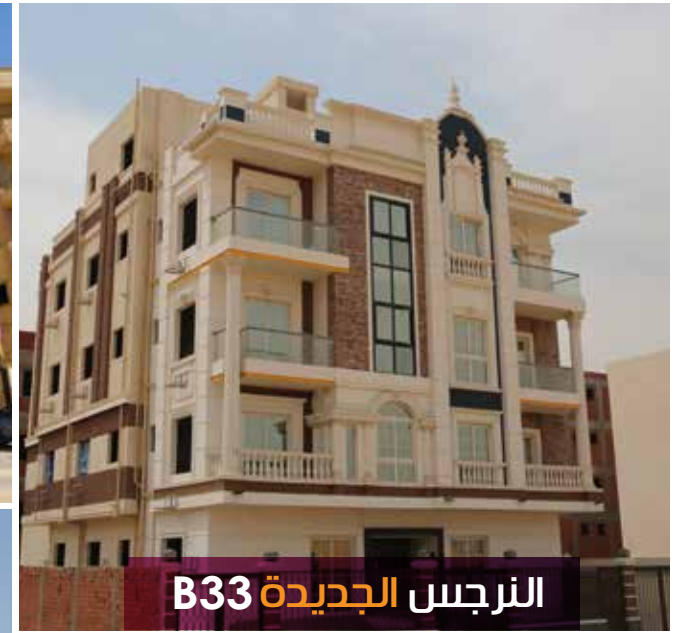
الترجس الجديدة B33